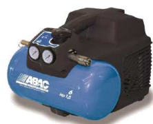
Version sans huile.