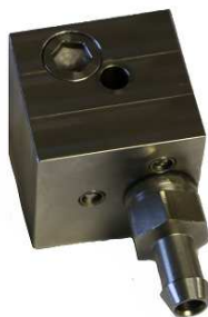
Les blocs "Ever Ready"